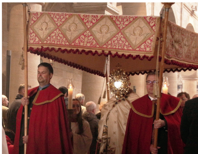
Durch einen „zufälligen“ Einfluß von außen bringt dieses nicht bearbeitete Foto von der Auferstehungsprozession am Ostersonntag symbolisch die Strahlkraft der Heiligen Eucharistie zum Ausdruck, die alles Dunkel unseres Lebens erhellt.